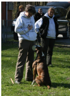
Apportieren (auch von Metallgegenständen), Richtungsapport

Zu den meist bekannten Gehorsamsübungen wie Fuß-Laufen, Sitz, Platz, Steh aus der Bewegung und Platz mit Abrufen kommen noch einige weitere Übungen, wie beispielsweise: