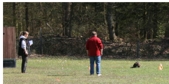
Wesensfestigkeit, vor allem gegenüber anderen Hunden Ablage (alle Hunde werden gleichzeitig abgelegt) mit und ohne Sichtkontakt hinzu.