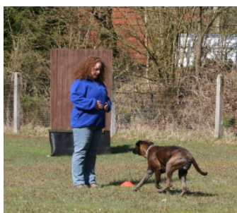
Distanzkontrolle, bei der der Hund in einem großen Abstand zu seinem Besitzer eine Reihe von Positionswechseln (Sitz, Platz, Steh) ausführen soll ohne sich dabei von der Stelle zu bewegen.